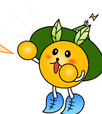
熊本市西区キャラクター「にしまる」

地域住民や行政職員も一緒になって活動します！ たくさんの方のご応募をお待ちしています！